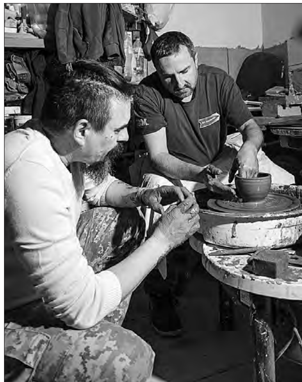
ПОЧАТОК НА 1-Й СТОР.

Свого часу після повернення з фронту саме гончарство допомогло Володимирі, який бився за Красногорівку та Мар'їнку у складі 14-ї