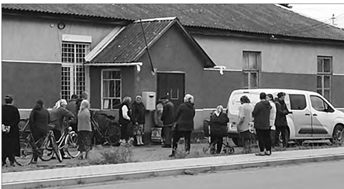
Антонівка (більш як 1300 осіб населення) Вараський район. Червень. Пенсіонери, особи з інвалідністю стоять годинами до пересувки, поряд — закрите відділення, що й досі в оренді «Укрпошти».